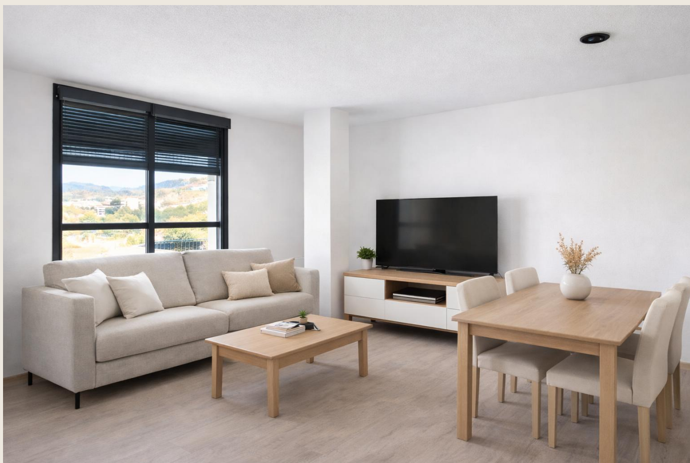
Salón-comedor — Fotografía real Las imágenes son orientativas y no vinculantes a nivel contractual.