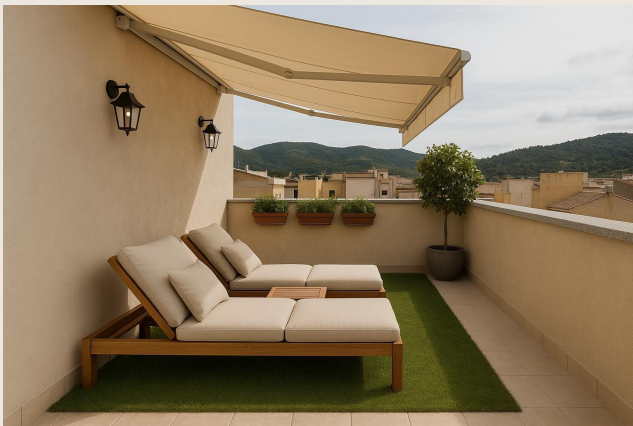
Solarium comunitario en azotea — imagen orientativa

Terraza-solarium comunitaria con tumbonas, mesa auxiliar y césped artificial para todos los propietarios.